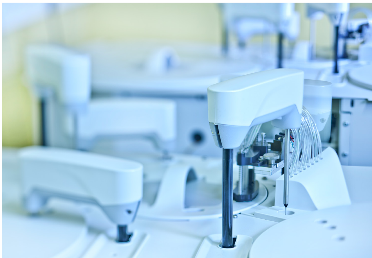
Unidad de limpieza del analizador

Desde la década de 1980, la empresa española BioSystems S.A. desarrolla y fabrica analizadores eficientes para laboratorios de investigación de todo el mundo. En su sede de Barcelona, un equipo joven y altamente cualificado se encarga de la Investigación&Desarrollo, fabricación y comercialización de una gama completa de analizadores para aplicaciones y equipos médicos. Con sistemas precisos y perfectamente adaptados a las necesidades del cliente, BioSystems persigue el objetivo de contribuir de forma significativa a la salud humana.