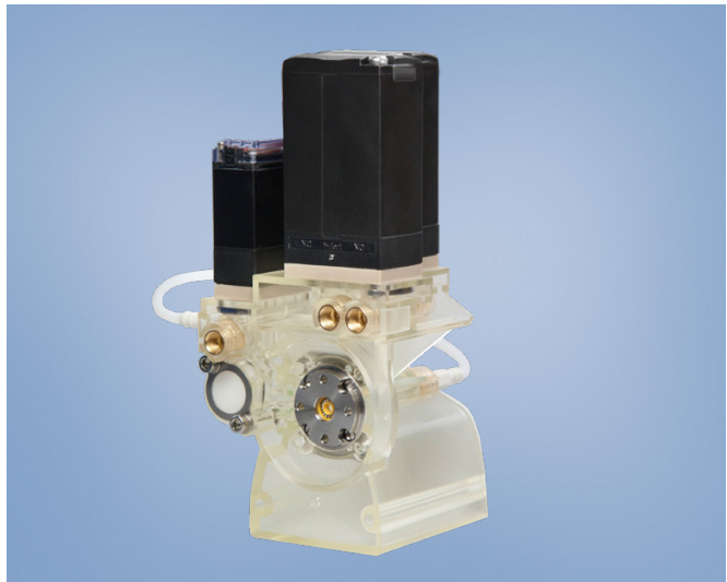
El sistema desarrollado por Bürkert (derecha) se encuentra montado modularmente y en diferentes analizadores (izquierda)

Systems y solicitar su colaboración. Las necesidades del cliente se definieron rápidamente: se trataba de desarrollar un sistema modular para el sistema de dosificación que permitiese dosificar con alta precisión una cantidad de fluido de tan solo dos microlitros (la precisión de dosificación viene dada por la bomba aportada por Biosystems, no por nada desarrollado en este proyecto). Esta cantidad es tan pequeña que no se puede ver a simple vista. La empresa confió en sus colaboradores alemanes para crear sinergias a través del trabajo conjunto. Con la nueva unidad de dosificación, se logró finalmente una solución „todo en uno“ cuyas válvulas pueden variar en número y función. La estructura con o sin sensor de presión también es variable, de modo que BioSystems puede instalar nuevas unidades de dosificación en cualquier equipo. Al mismo tiempo, la solución desarrollada por estas dos empresas colaboradoras resulta más eficaz y económica que los sistemas precedentes.