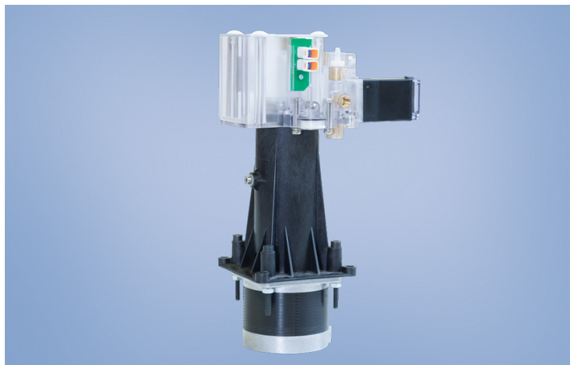
The washing process within the instrument is essential and realised by the Bürkert system (right)