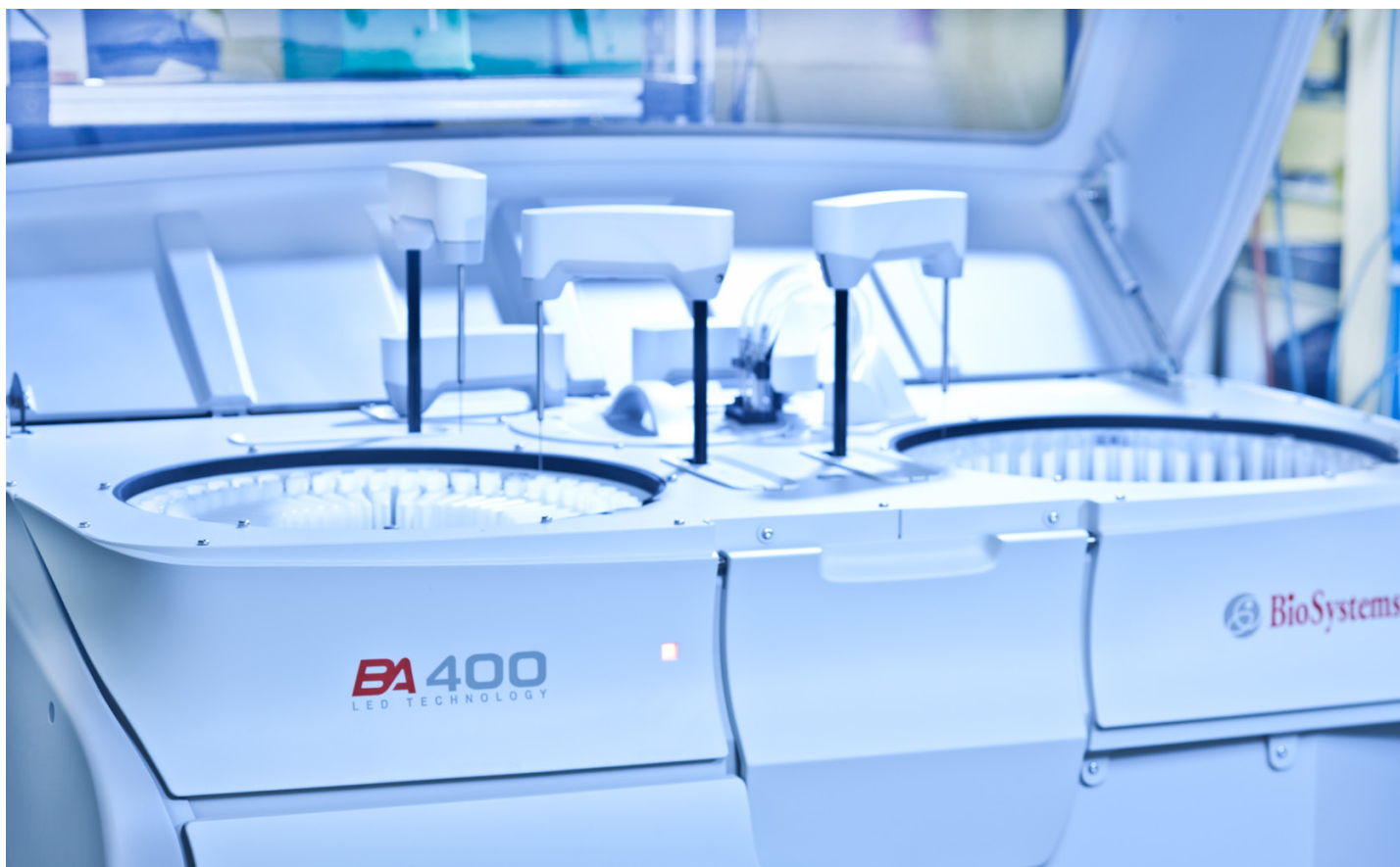
En la producción del analizador también se utilizan válvulas de Bürkert

Un desafío técnico de no poca importancia, pues la unidad de dosificación completa consta de cinco componentes integrados: una unidad de inyección, dos válvulas, un sensor de presión y un filtro en una pieza de plástico transparente moldeada por inyección. El número de unidades dosificadoras requeridas varía en función del modelo de analizador. Por este motivo, muy pronto se hizo evidente que el nuevo producto necesitaría una estructura modular que pudiera utilizarse sola o combinada de forma ilimitada en función de las necesidades. A esto se añade que en el ámbito de la microfluídica, es decir, el control de fluidos en un espacio mínimo, requiere una precisión de dosificación extremadamente alta. Los ingenieros de BioSystems decidieron, por tanto, apostar por los amplios conocimientos y experiencia de Bürkert Fluid Control